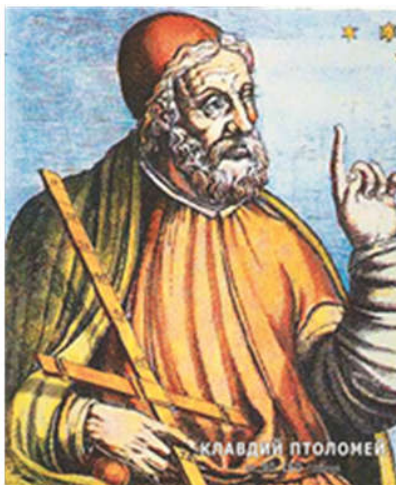
Клавдий Птоломей ок. 90 - ок 160

Научната революция зароди в някои западни интелектуалци илюзията, че в близко бъдеще всички тайни на природата ще бъдат разкрити с помощта на разума и