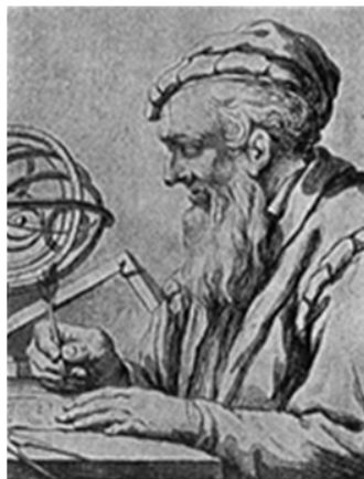
Гуидо Бонати 13 век.

Заедно с това, до края на XX век се е увеличил интересът към класическите астрологическите творбите, към тези